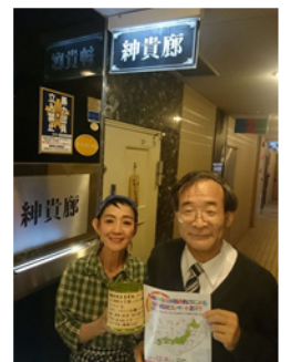
本コンサートの活動資金につきまして紳貴廊様(福岡市中央区西中洲)に全面的にご協力をいただきました。