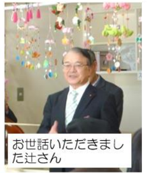
お世話いただきましたさん