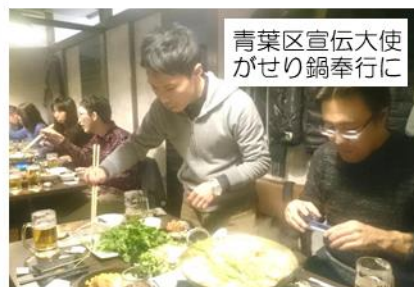
青葉区宣伝大使 がせり鍋奉行に