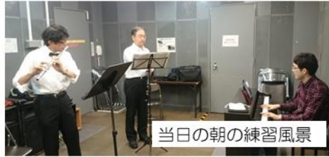
当日の朝の練習風景