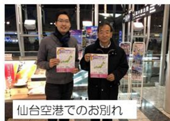
仙台空港でのお別れ