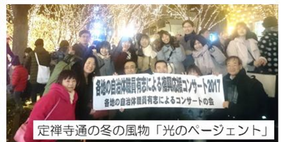
定禅寺通の冬の風物「光のページェント」