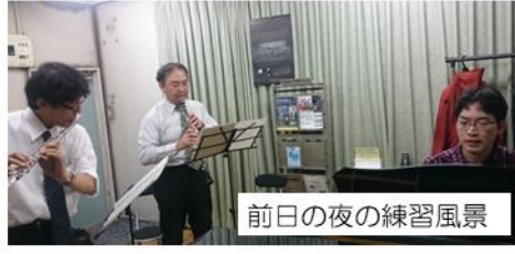
前日の夜の練習風景