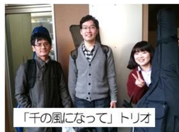
「千の風になって」トリオ