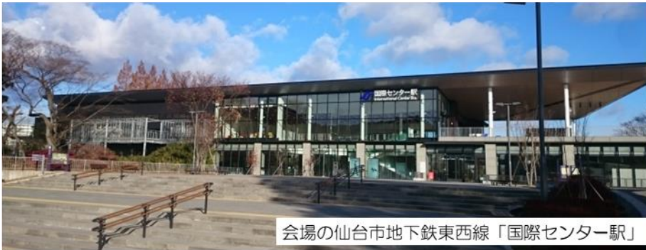
会場の仙台市地下鉄東西線「国際センター駅」

会場は市営地下鉄に併設するスペースということで楽器の音量に気を使わなければなりませんでした、無事に、盛会のうちに終演することができました。