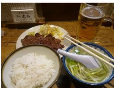
仙台市ではやっぱり牛タン定食