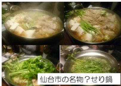
仙台市の名物?せり鍋